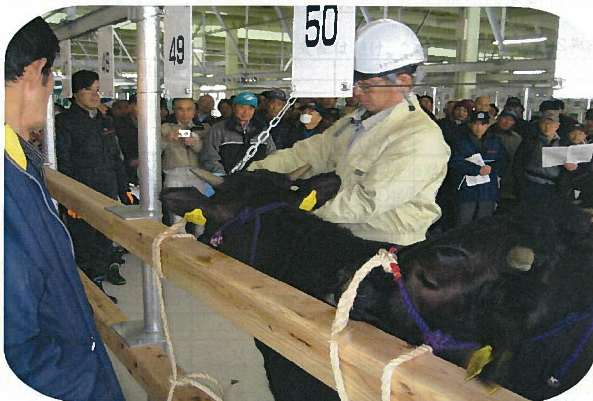
(内覧会の様子：誘導レールの牛への装着を実演)

待望の「あきた総合家畜市場」が完成し、3月5日から8日まで内覧会が開催されました。