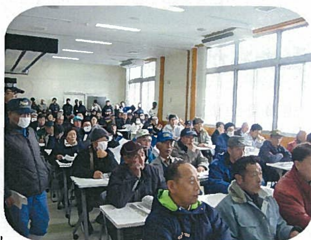
(熱気あふれる説明会の様子)

参加者からは、「立派な市場を整備してもらった。市場に負けない牛を作って上場したい。」との声も上がるなど、新たな肉用牛振興の拠点としての熱い期待で会場が熱気に包まれました。