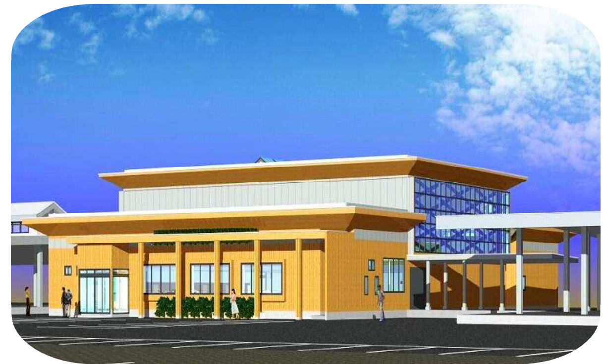
【セリ場兼事務所棟完成予想図】