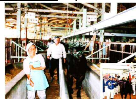
【女性や高齢者にも優しい家畜誘導レール】 （つなぎ場 → セリ場 → けい養畜舎）